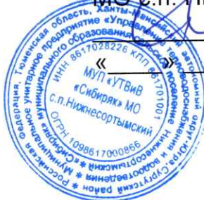
График отключения ГВС (горячего водоснабжения) на период планового профилактического ремонта и обслуживания при подготовке к осенне-зимнему периоду 2026/2027гг. МУП «УТВиВ «Сибиряк» МО с.п. Нижнесортымский.