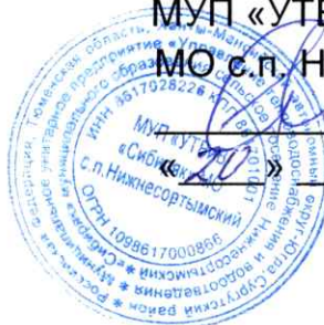
График отключения ГВС (горячего водоснабжения) на период планового профилактического ремонта и обслуживания при подготовке к осенне-зимнему периоду 2024/2025гг. МУП «УТВиВ «Сибиряк» МО с.п. Нижнесортымский.